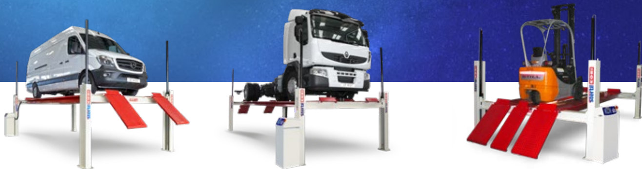
Opcjonalna trzecia platforma dla 3-kolowych wózków widłowych.

Stertil-Koni oferuje Klientom na całym świecie szeroką gamę podnośników do podnoszenia ciężkich pojazdów użytkowych oraz akcesoria podnośnikowe. Wszystkie podnośniki samochodowe są projektowane i produkowane przez zespół profesjonalistów specjalizujących się w podnoszeniu ciężkich pojazdów użytkowych. Stertil-Koni jest obecny na całym świecie dzięki lokalnym oddziałom sprzedaży, dystrybutorom oraz sieci wykwalifikowanych partnerów serwisowych. Dzięki tym staraniom Stertil-Koni jest światowym liderem w branży podnoszenia pojazdów ciężarowych.